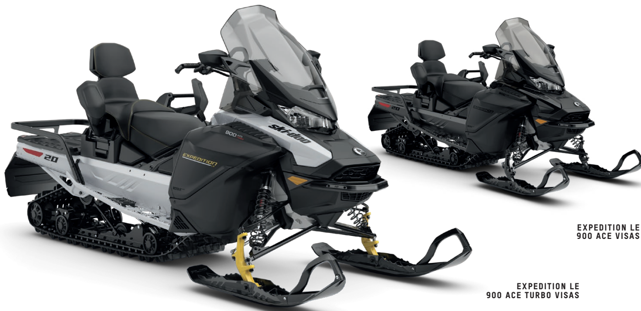
EXPEDITION LE 900 ACE VISAS