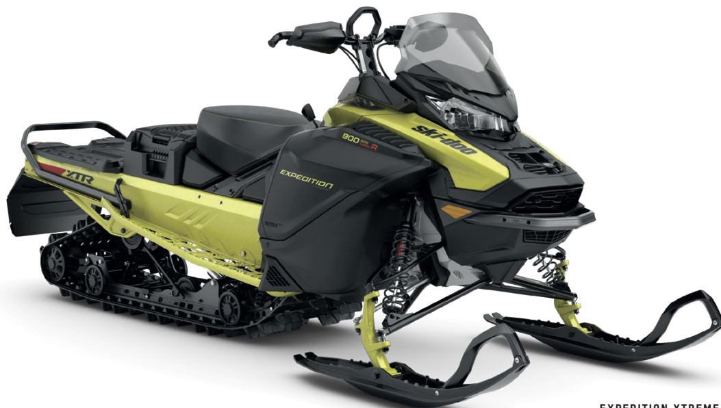
EXPEDITION XTREME 900 ACE TURBO R VISAS