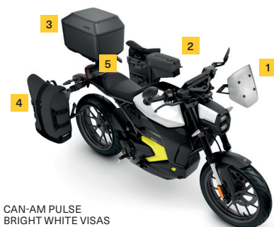
CAN-AM PULSE BRIGHT WHITE VISAS

Fullständig integration av LinQ och LinQ Nano