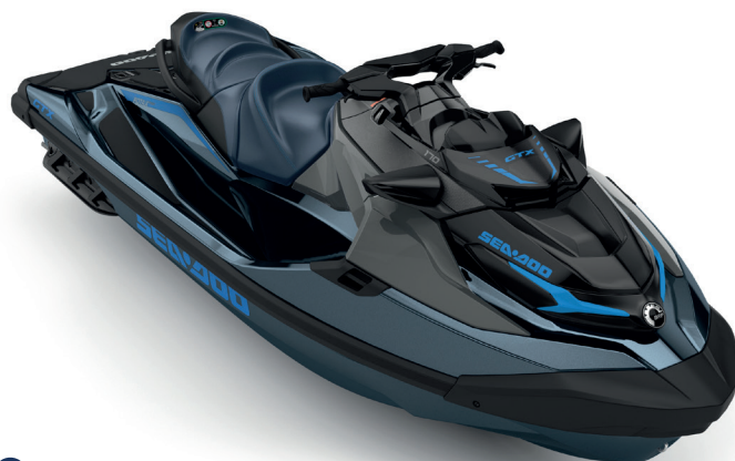
Blue Abyss / Gulfstream Blue